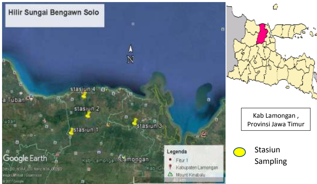
Gambar 1. Lokasi penelitian

sampling. Pengambilan sampel ikan dilakukan pada empat lokasi yaitu Bendungan Gerak Babat Kecamatan Sekaran (Stasiun 1), Bendungan Plangwot Kecamatan Laren (Stasiun 2), Sungai Banyu Urip Kecamatan Karang Binangun (Stasiun 3), Bendungan Karet Sedayu Lawas Kecamatan Brondong (Stasiun 4) (Gambar 1). Pengambilan sampel dilakukan setiap dua minggu dengan menggunakan alat tangkap jaring insang (gill net), jala tebar (cast net), pancing (hand line), serta anco. Sampel ikan yang tertangkap akan di masukkan dalam kantong plastik dan diawetkan dengan formalin yang selanjutnya diidentifikasi dengan Buku Kottelat et. al.,(1993).