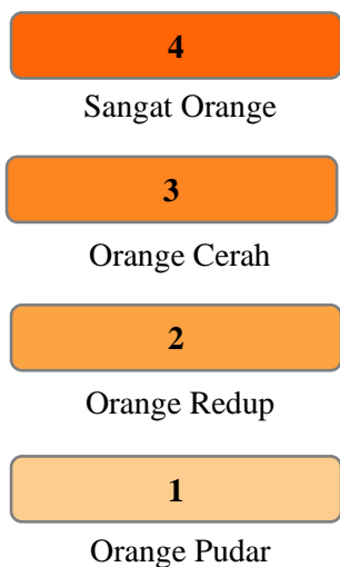
Gambar 1. Penilaian performa warna ikan Carassius auratus

Sugiyono (2008) yang dikutip dalam (Anwar et al. , 2021) metode papan skor ini mengacu pada tingkat kecerahan warna Orange yang dibagi menjadi empat kategori penilaian: Orange Pudar (Peringkat 0-1.0), Orange Redup (Peringkat 1.1-2.0), Orange Cerah (Peringkat 2.1-3.0) dan Sangat Orange (Peringkat 3.1-4.0). Penilaian performa warna dari ikan Carrasius auratus tersebut ditunjukkan pada Gambar 1 dan Gambar 2.